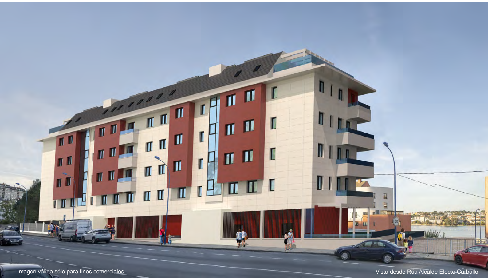
Imagen válida sólo para fines comerciales.