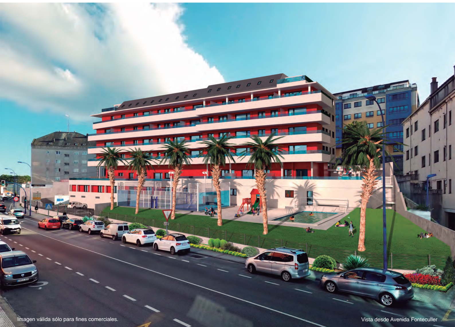
Imagen válida sólo para fines comerciales.